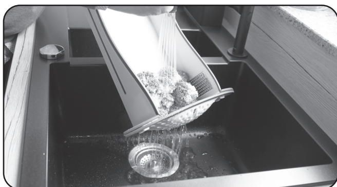
Universell nutzbares Sieb und Abwaschschüssel Universal colander and washing-up bowl