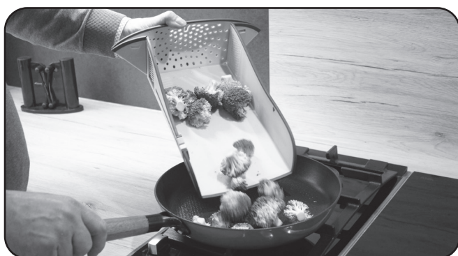
Praktische Schütte Practical chute