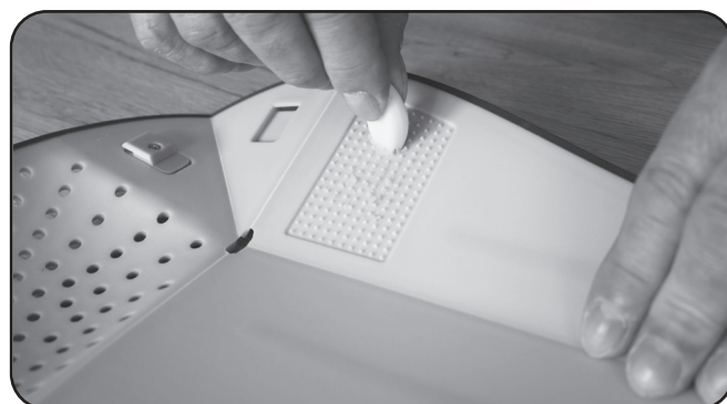
Effektive Reibe für Knoblauch, Ingwer, Gewürze Effective grater for garlic, ginger, spices