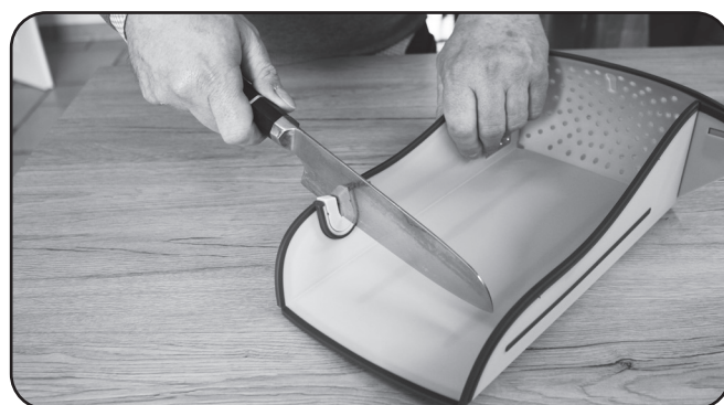
Präziser Messeschärfer Precise knife sharpener