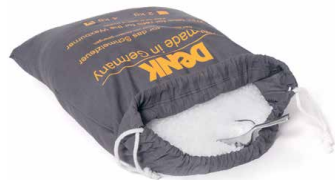
Wachspastillen zum Nachfüllen SFP2 2kg SFP4 4kg