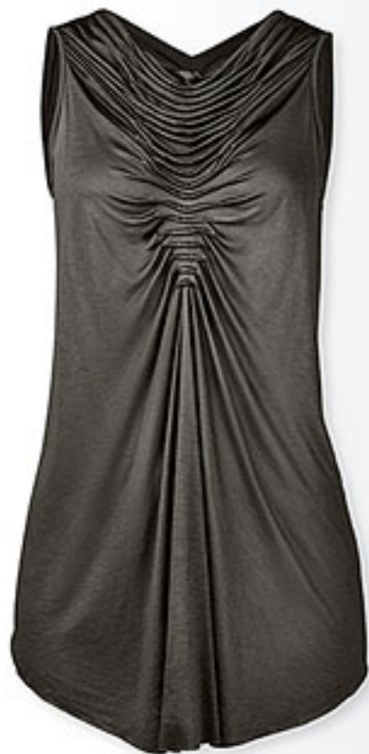
Plein Sud Jeanius Blazer-Top: www.fashion-charts.de oder Tel.: 0241-109 119.